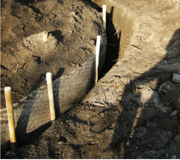
Lite-Rootprotect M y L