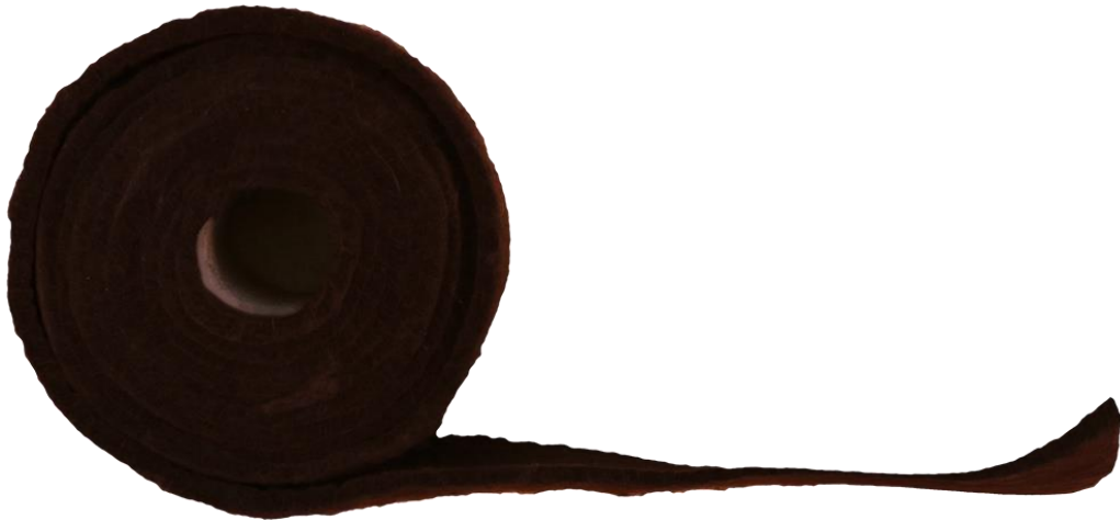
Lite-Rootprotect vendaje para raíces

Lite-Rootprotect no sólo protege contra el sol y contra daños , sino que también mantiene las raíces permanentemente húmedas . Lite-Rootprotect es 100% biodegradable y por lo tanto no tiene que ser desmontado.